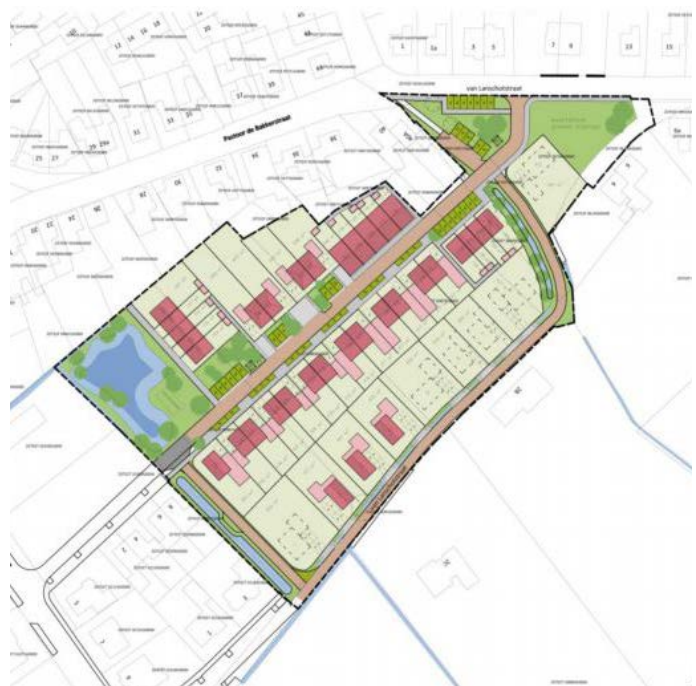
> Sfeerimpressies van Bestemmingsplan Achtmaal Zuid.